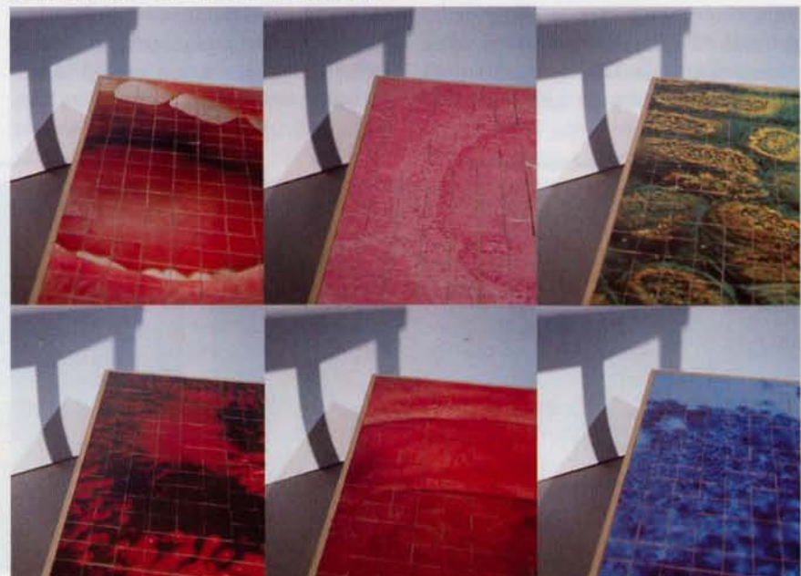
Eettafel met microscopische foto's van ingewanden

microscopische foto's van ingewanden staan afgebeeld. Afhankelijk van hoe je de kubussen rangschikt kun je zien wat er op die foto's staat, maar afzonderlijk zijn ze op zich niet herkenbaar.'