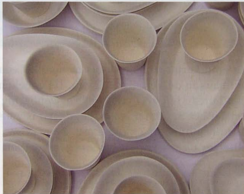
Porseleinen servies in vrouwelijke vormen

seerd op hetzelfde thema als mijn eerdere voedselontwerpen en bestond feitelijk uit een compleet horecaconcept, waarbij gezonde voeding en de juiste verhouding tussen eten en drinken, maar dus vooral lust, centraal stonden. Daarnaast heb ik de huisstijl ontworpen, evenals het interieur, met lange, hoge tafels om het bewegen en daarmee verleiden wat te vergemakkelijken. En ik heb zelf het porseleinen servies in organische, vrouwelijke vorm gemaakt én de publiciteit gedaan - ik heb in meerdere kranten en vakbladen gestaan.