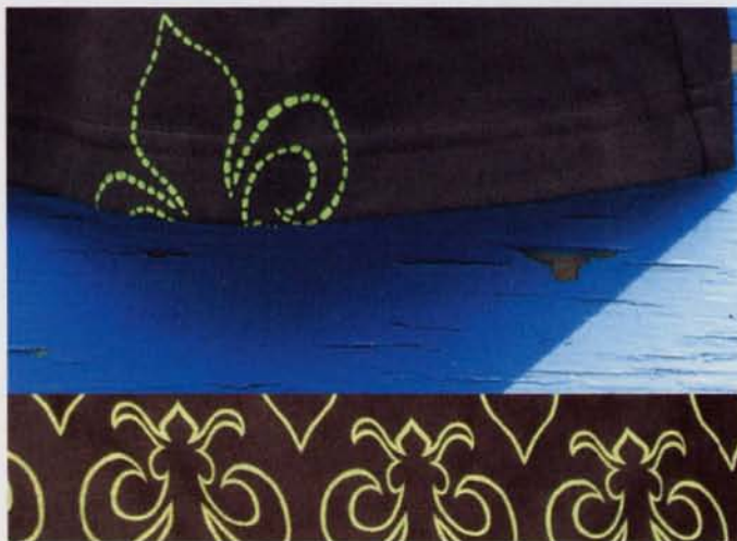
The pleasure of discovery

maar het is nu nog te zwaar om comfortabel te dragen.'