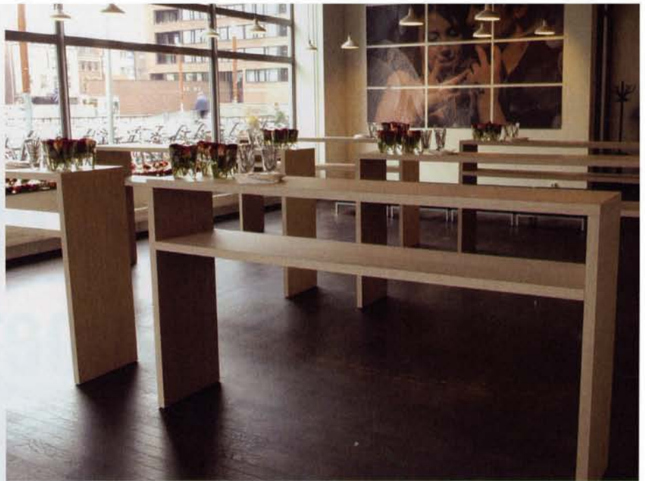
'Cocktails & Companions'